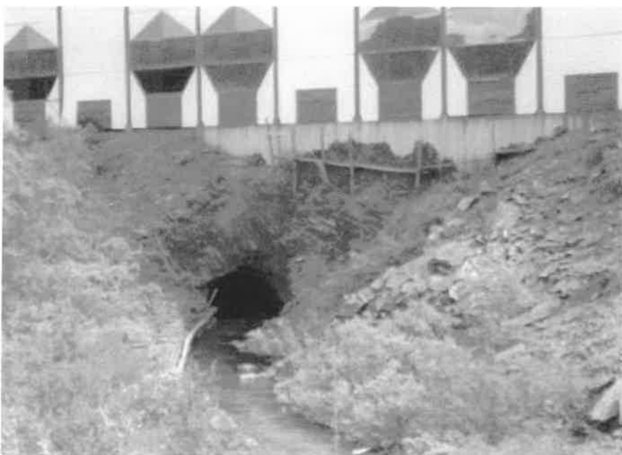
Vanntunneln vid km 38,95 vid Solheimbrakka.