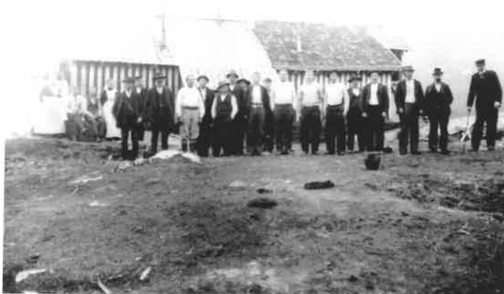
Överst: Vassijaure ca 1900. Nederst: Transportvägen nära omlastningsstationen ca 1900.