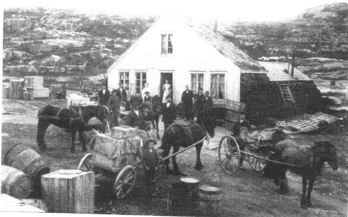
Fjellstuen vid Nordalsenden inte långt från Bjørnfjell och den svenska gränsen. Här rastade körarna och fick sig något till livs i Hagfors kafé. Foto ca 1901.